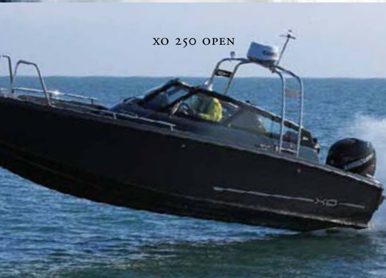
XO 250 OPEN