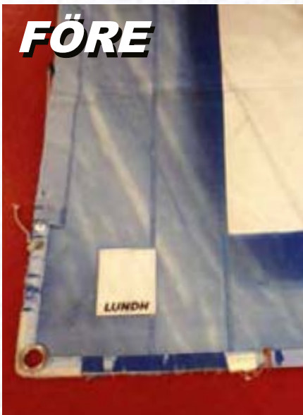
Förbrukat UV-skydd förstör seglet.