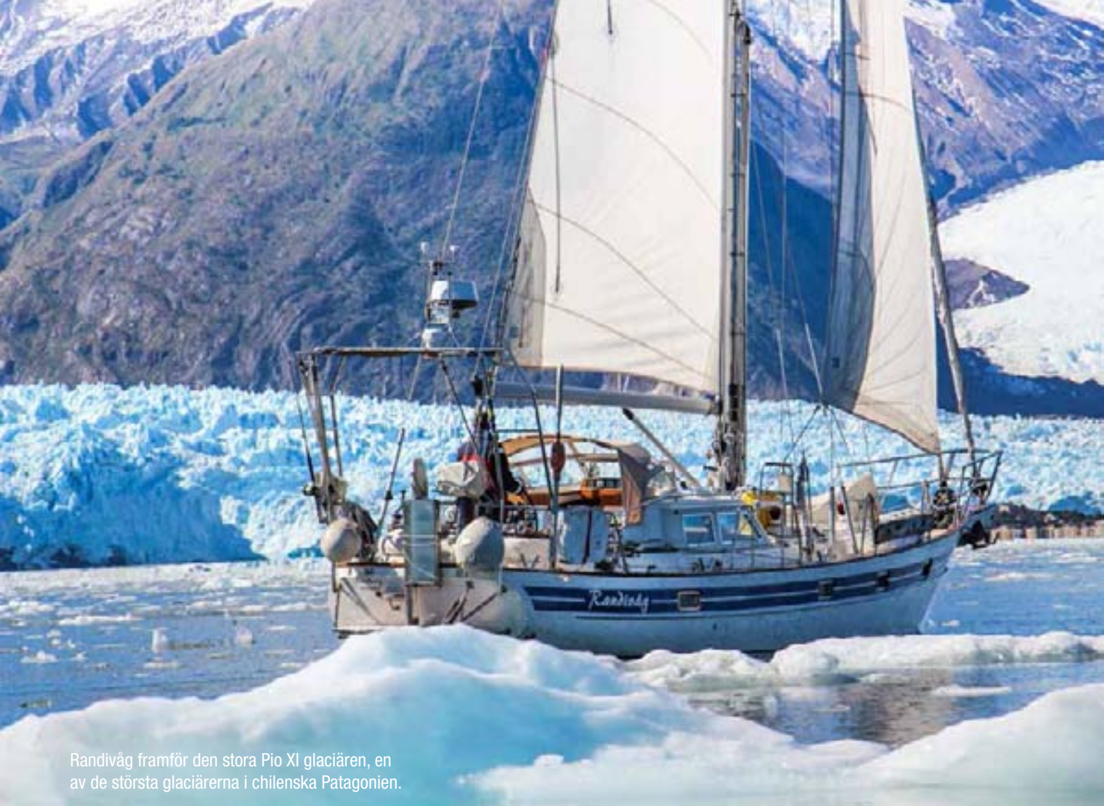
Randivåg framför den stora Pio XI glaciären, en av de största glaciärerna i chilenska Patagonien.