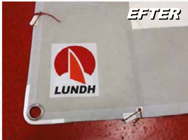
UV-renoveringen ger 3-5 års ökad livslängd.