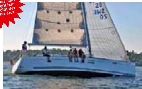
Dufor 40 E