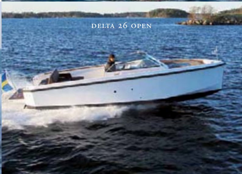
DELTA 26 OPEN