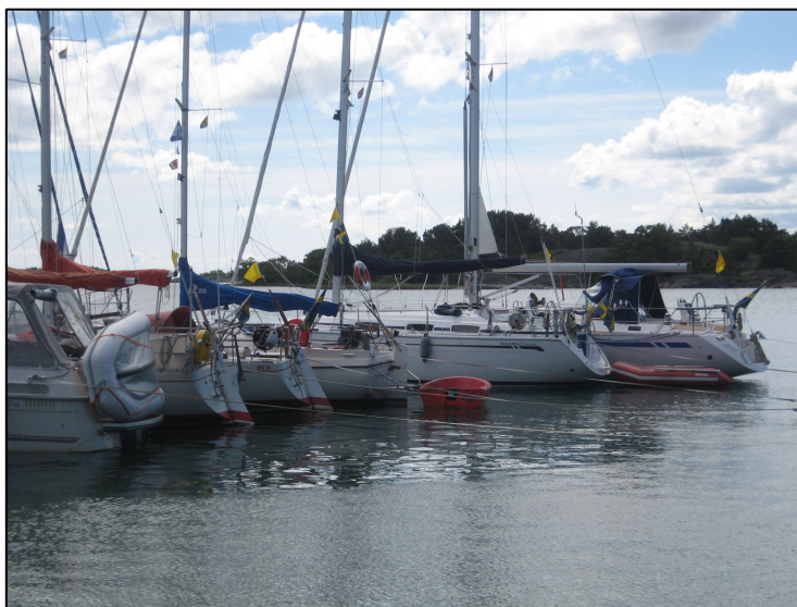
Så här såg det ut sommaren 2008.

Hör av er till Kjell & Birgitta 021-35 70 75 eller kjell-birgitta@swipnet.se