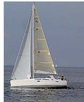
Bild 8 Fotografen är nu närmare tvärskepps linjen. Fockens akterlikt och mast börjar att gå ihop.

Bild 7 Som ni ser, är fotot taget något för om tvärskepp. Focken har ett utbyggt akterlikt, som när in på nästan hela mastprofilen, men på bilden upplever man att den slutar framför masten.