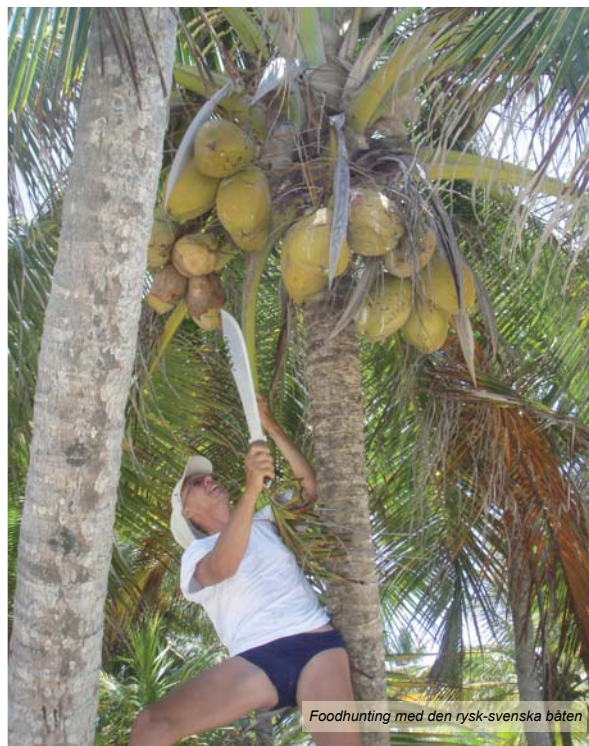
Foodhunting med den rysk-svenska båten