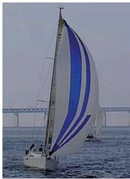
Bild 6 Från den här vinkeln, ser kurvan ut att ha en jämn bög eller bäge

Bild 5 Ny kameravinkel och förlikskurva har börjat jämnas ut sig.