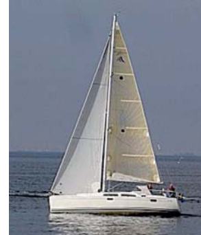
Bild 9 Kamerans vinkel tvärs Vera. Fockens akterlikt är helt täckt av mastprofilen.

Bild 8 Fotografen är nu närmare tvärskepps linjen. Fockens akterlikt och mast börjar att gå ihop.